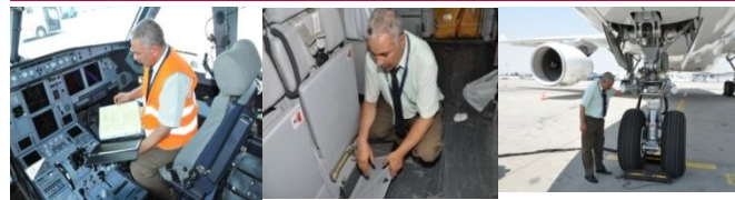
Assistance & Accompagnement