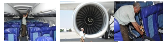
Formation sur site